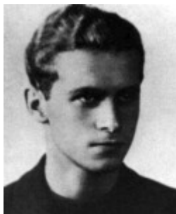
Krzysztof Kamil Baczyński