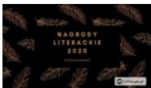
Książki nagrodzone w 2020