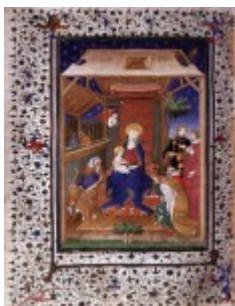
Leonardo, Pokłon Trzech Króli, 1482