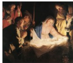
Honthorst, Pokłon pasterzy, 1622