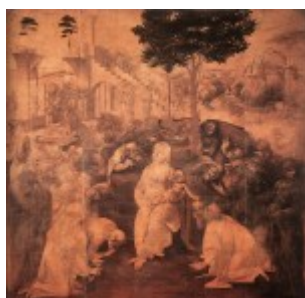
Leonardo, Pokłon Trzech Króli, 1482