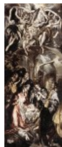
El Greco, Pokłon pasterzy, 1600