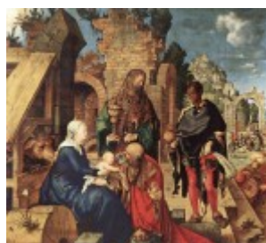
Durer, Pokłon Trzech Króli, 1504