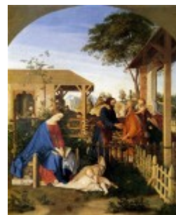
Schnorr von Carolsfeld, Święta Rodzina – odwiedziny rodziny św. Jana