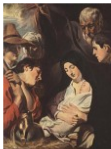
Jordaens, Pokłon pasterzy, 1617