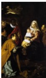
Velazquez, Pokłon Trzech Króli, 1619