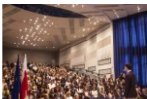
Sala Błękitna Lubelskiego Urzędu Wojewódzkieg o