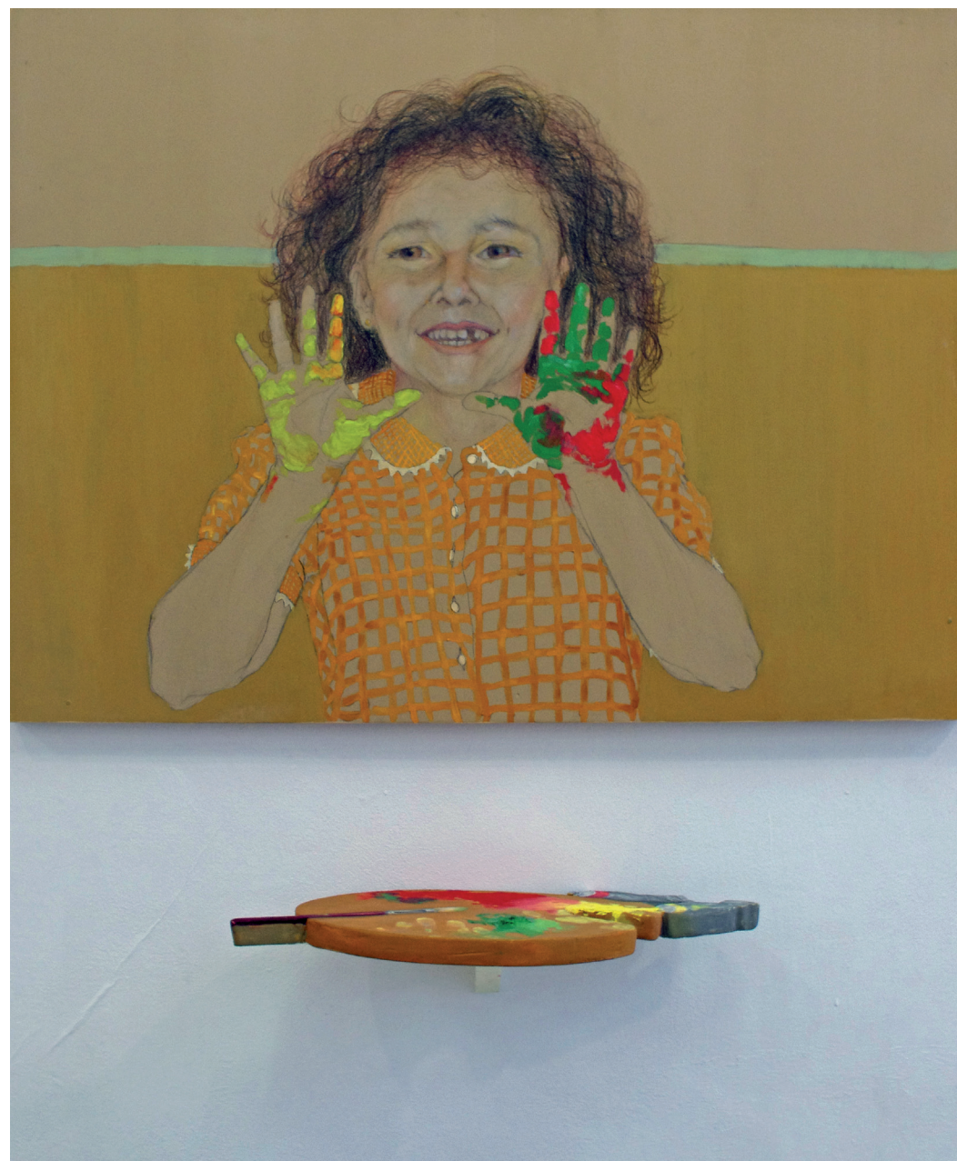
Paulina Litwin | bez tytułu | 60x80 cm | olej na płycie mdf | obiekt | 2011