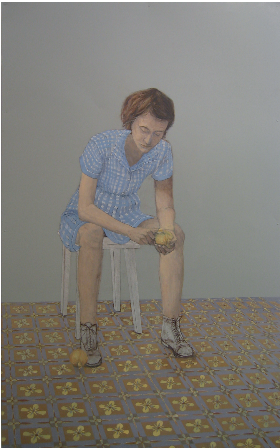
Karolina Wlodek | bez tytułu | 160x100 cm | olej na blasze | 2011