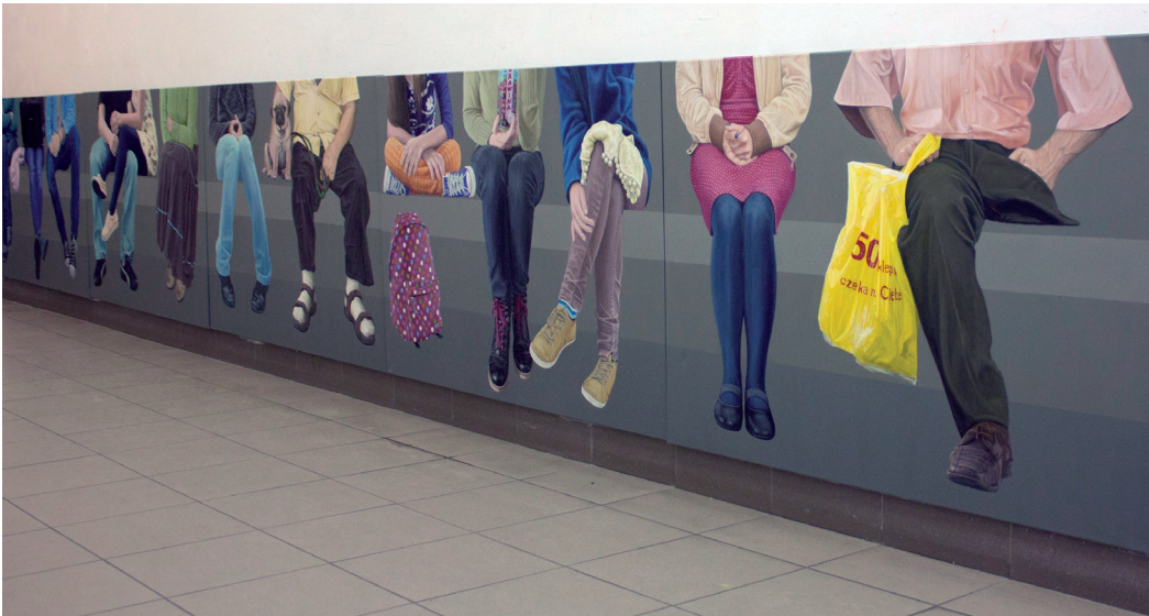
Jolanta Lach | bez tytułu | 600x70 cm | olej na płótnie | 2011