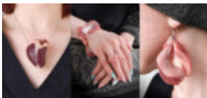
Gabriela Gaworska – „Pokaż kotku, co masz w środku” klasa 3b

Prace zakwalifikowane do wystawy pokonkursowej: