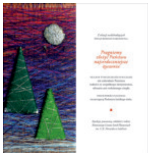
autor projektu: Kaja Pawlik