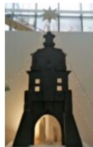
autor szopki: sekcja snycerska