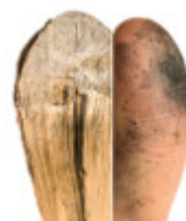
Srebrny Medal / Silver Medal – ex aequo – „Linie” – Alicja Wierzchoń klasa 3b

Prace zakwalifikowane do wystawy pokonkursowej: