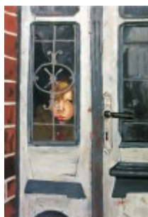
GRAND PRIX Marcin Różański – PLSP Zamość, Samotność – malarstwo