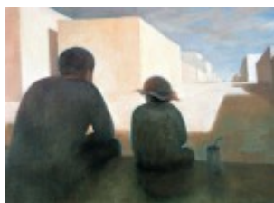
I miejsce Mateusz Bielecki – PLSP Nałęczów, Spotkanie – malarstwo