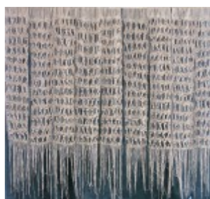
III miejsce Agnieszka Flor – PLSP Lublin, łańcuch życia – tkanina