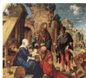
Durer, Pokłon Trzech Króli, 1504