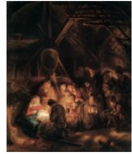
Rembrandt, Pokłon pasterzy, 1646