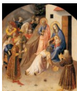
Fra Angelico, Pokłon Trzech Króli, 1424