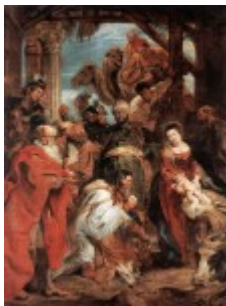
Rubens, Pokłon Trzech Króli, 1624