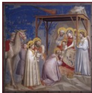
Giotto, Pokłon Trzech Króli, Capella Scrovegni, 1306