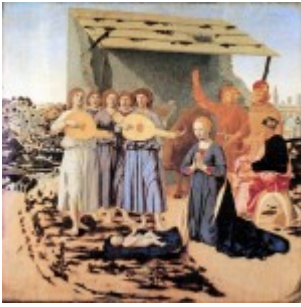
Piero della Francesca, Narodziny, 1475