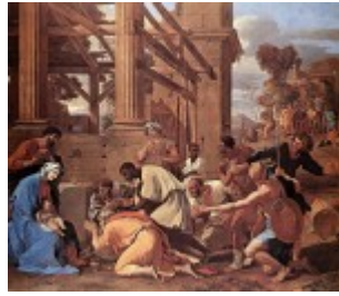
Poussin, Pokłon Trzech Króli, 1633