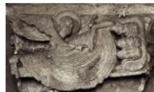
Gislebert, Sen Trzech Króli, 1130