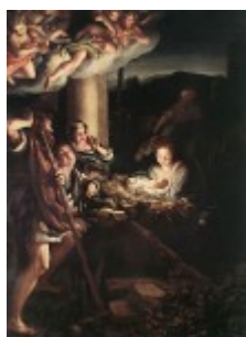
Correggio, Pokłon pasterzy, 1530