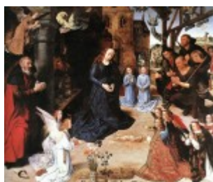
Goes, Tryptyk Portinarich, 1479