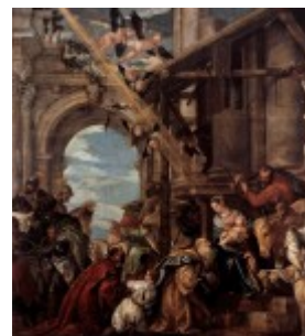
Veronese, Pokłon Trzech