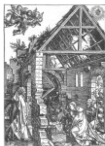
Durer, Narodziny, 1505