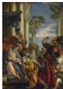
Veronese, Pokłon Trzech Króli, 1570