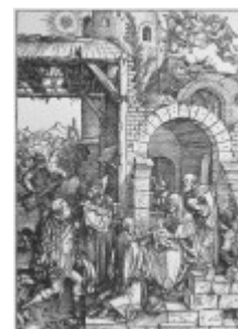
Durer, Pokłon Trzech Króli, 1505