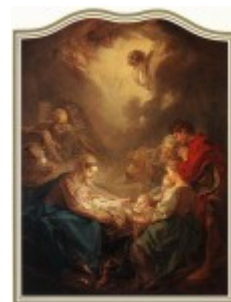
Boucher, Pokłon pasterzy, 1750