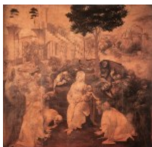
Leonardo, Pokłon Trzech Króli, 1482