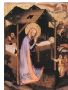
Mistrz z Trzebonia, 1380