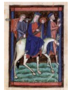
Ucieczka do Egiptu, manuscript XIII w. Venice