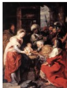
Rubens, Pokłon Trzech Króli, 1629