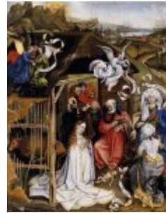
R. Campin, Pokłon Trzech Króli, 1420