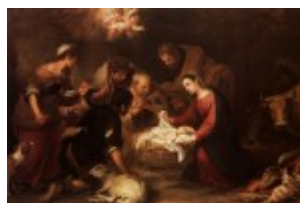
Murillo, Pokłon pasterzy, 1668