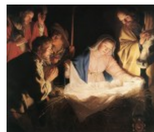
Honthorst, Pokłon pasterzy, 1622