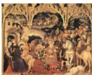
Gentile da Fabriano, Pokłon Trzech Króli, 1423