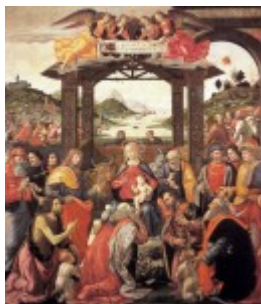
Ghirlandaio, Pokłon Trzech Króli, 1488