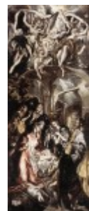
El Greco, Pokłon pasterzy, 1600