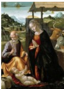
Ghirlandaio, Narodziny, 1490