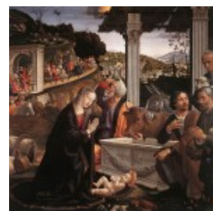
Ghirlandaio, Pokłon pasterzy, 1485