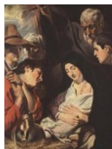
Jordaens, Pokłon pasterzy, 1617