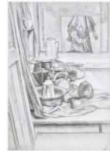
Dorota Zarucka kl. IC, n. L. Duma

Kliknięcie w miniaturkę obrazka spowoduje wyświetlenie powiększonego zdjęcia.