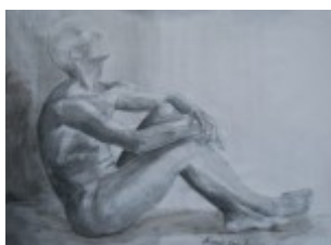
Rys. 1 Ba Kadidia, IIA, n. A. Krasowski

Wszystkie prace, które wpłynęły na konkurs