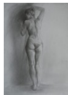
Rys. 3 Niścior