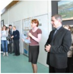
Ogłoszenie wyników konkursu