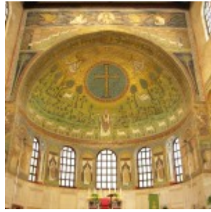
mozaiki Sant'Apollinare in Classe