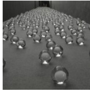
Not Vital 700 Snowballs