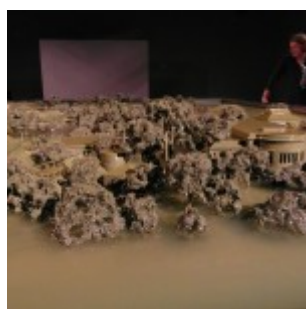
Alfredo Jaar -Chile