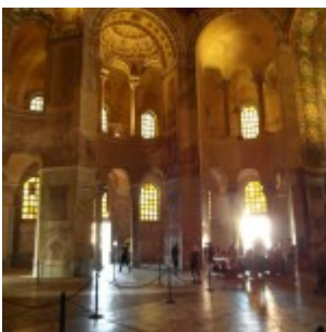
San Vitale, Ravenna