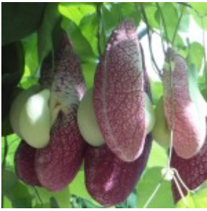
Orto Botanico, Padwa