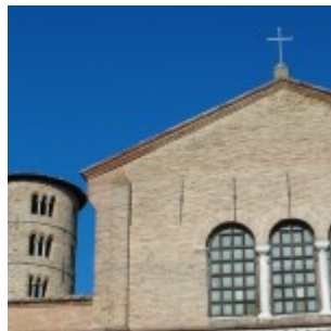
Sant'Apollinare in Classe