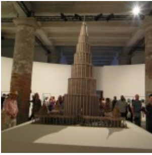
Marino Auriti Palazzo Enciclopedico