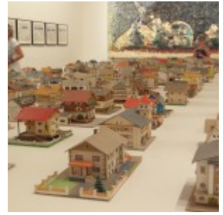
Oliver Croy, Oliver Elser