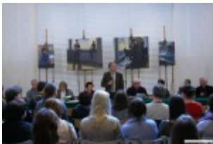
Ogłoszenie wyników przez Jury