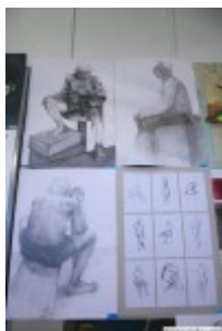
M. Majczyna (rysunki)