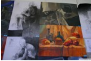
Prace naszych uczestników