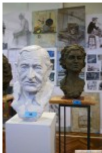
Głowa Pana Janka K. Mizińskiej, N. prowadzący: W. Arbaczewski, A. Kasprzak

Uczennicom i przygotowującym je nauczycielom gratulujemy!