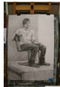
M. Majczyna (rysunek)