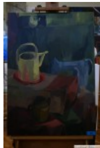
A. Sawoniuk (martwa natura)