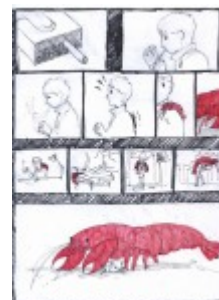
III miejsce – Emilia Sieńko