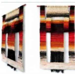
autor: Agnieszka Zarzeczna