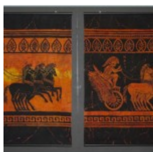
autor: Agnieszka Kordyga