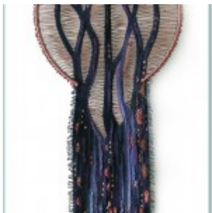
autor: Ada Usarek