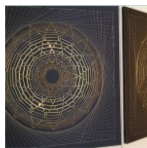
autor: Dorota Żydek