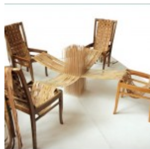
autor: Milena Gałązka