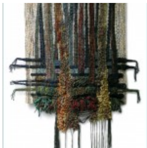
autor: Anna Łapińska