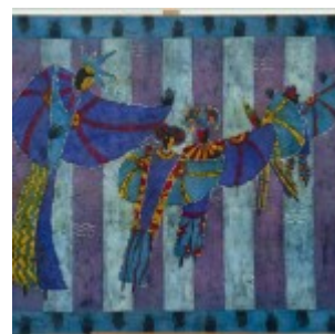
autor: Anna Łapińska