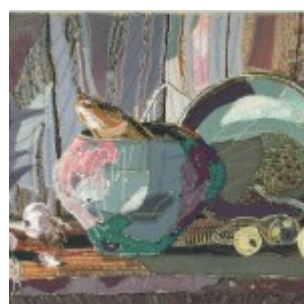
autor: Aneta Głębicka