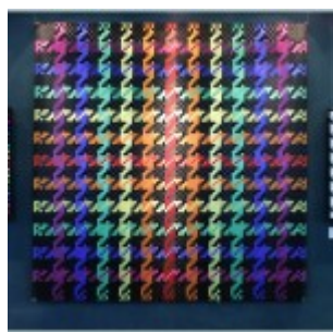
autor: Karolina Gajos