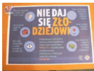
Plakat, N. Klimowicz, K. Gołuch