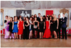
2010 „Carska Rosja”