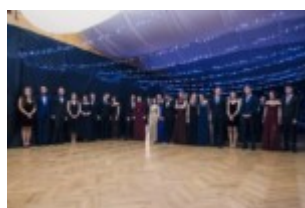
2018 „Noc polarna”