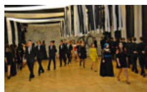
2017 „Lata 60-te”