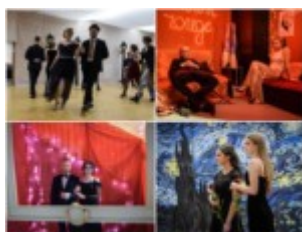
2019 „0 północy w Paryżu”

Nasza szkoła należy do nielicznych w Polsce, która od zawsze organizuje tradycyjną zabawę dla maturzystów u siebie, a nie w wynajętej sali. Piękną tradycją także stało się, że uczniowie ostatnich klas sami przygotowują scenografię swojej studniówki w wybranym przez siebie stylu. A wszystko po to, aby była ona wyjątkowa, niepowtarzalna i niezapomniana. Zobaczcie, w jakich klimatach bawiono się w latach ubiegłych.