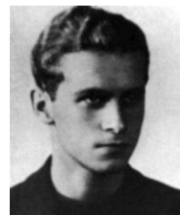
Krzysztof Kamil Baczyński