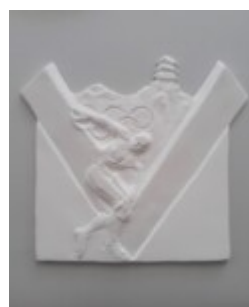
W. Marucha, awers