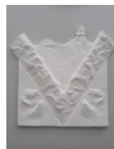
W. Marucha, rewers