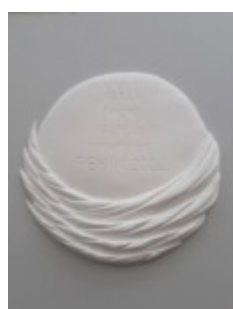
N. Godyńska, rewers