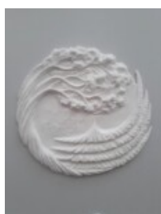
N. Godyńska, awers