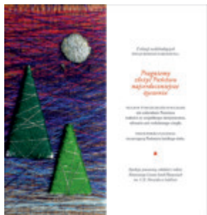
autor projektu: Kaja Pawlik