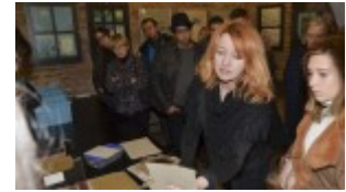
Izba Drukarstwa Domu Słów „Ośrodek Brama Grodzka – Teatru NN”