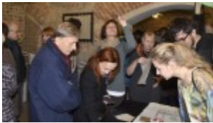
Izba Drukarstwa Domu Słów „Ośrodek Brama Grodzka – Teatru NN”