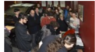
Izba Drukarstwa Domu Słów „Ośrodek Brama Grodzka – Teatru NN”