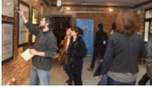
Izba Drukarstwa Domu Słów „Ośrodka Brama Grodzka – Teatru NN”