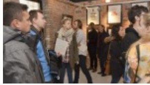
Izba Drukarstwa Domu Słów „Ośrodek Brama Grodzka – Teatru NN”