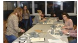
Zajęcia warsztatowe z uczniami w szkolnych pracowniach