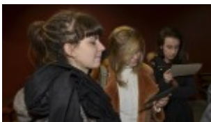
Izba Drukarstwa Domu Słów „Ośrodek Brama Grodzka – Teatru NN”