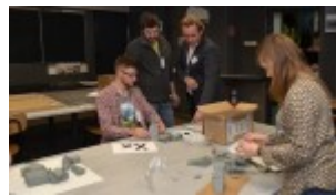
Zajęcia warsztatowe z uczniami w szkolnych pracowniach