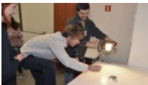
Zajęcia warsztatowe z uczniami w szkolnych pracowniach