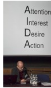
Prezentacja prof. B. Krasulaka z ASP Warszawa