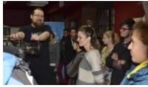
Izba Drukarstwa Domu Słów „Ośrodek Brama Grodzka – Teatru NN”