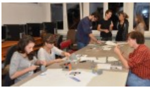
Zajęcia warsztatowe z uczniami w szkolnych pracowniach