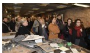
Izba Drukarstwa Domu Słów „Ośrodku Brama Grodzka – Teatru