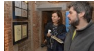
Izba Drukarstwa Domu Słów „Ośrodek Brama Grodzka – Teatru NN”