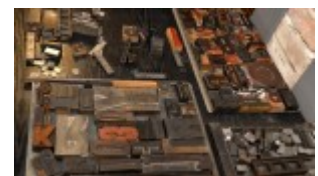
Izba Drukarstwa Domu Słów „Ośrodku Brama Grodzka – Teatru