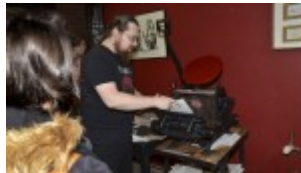
Izba Drukarstwa Domu Słów „Ośrodek Brama Grodzka – Teatru NN”