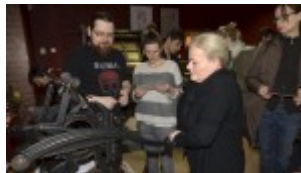
Izba Drukarstwa Domu Słów „Ośrodek Brama Grodzka – Teatru NN”