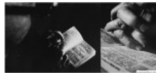
Monika Juraszek – ZSP w Bielsku – Białej, „Modlitwa końca wieku”, malarstwo