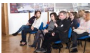
W pierwszym rzędzie (od