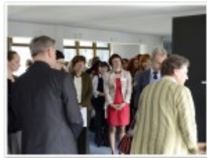
Zaproszeni goście w Szkolnej Galerii