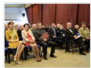
Organizatorzy Konkursu. Od lewej- Prezes Stowarzyszenia Lubelski Plastyk, dyrekcja ZSP, wizytatorzy CEA