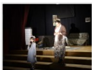
Spektakl Sceny z