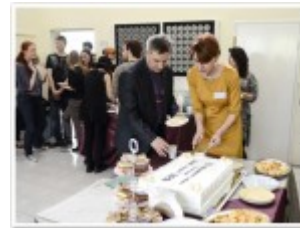
Poczęstunek dla zaproszonych gości