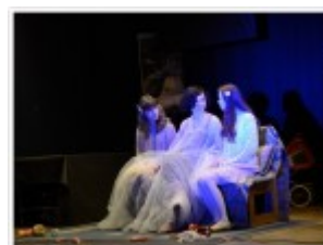
Sceny z życia