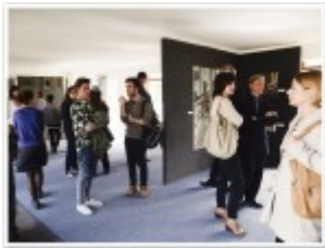
Wernisaż wystawy pokonkursowej