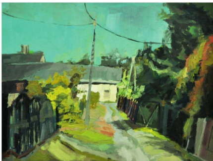
Agata Golik, 2014 - olej na płótnie