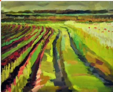
Agata Golik, 2014 - olej na płótnie