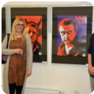
Wernisaż wystawy "Plakaty" - fotorelacja