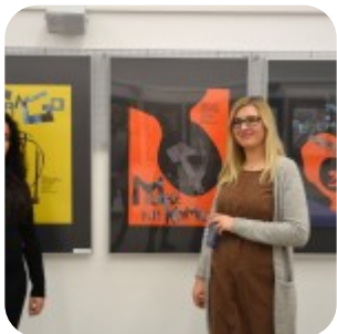
Wernisaż wystawy "Plakaty" - fotorelacja