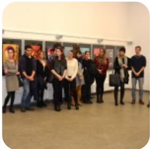
Wernisaż wystawy "Plakaty" - fotorelacja