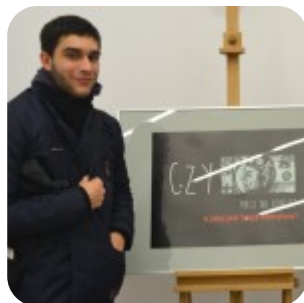
Wernisaż wystawy "Plakaty" - fotorelacja