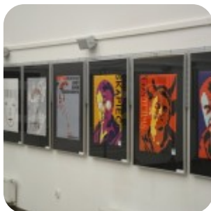
Wernisaż wystawy "Plakaty" - fotorelacja