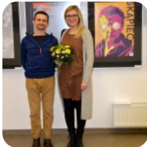
Wernisaż wystawy "Plakaty" - fotorelacja