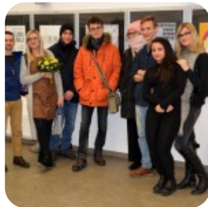
Wernisaż wystawy "Plakaty" - fotorelacja