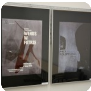
Wernisaż wystawy "Plakaty" - fotorelacja