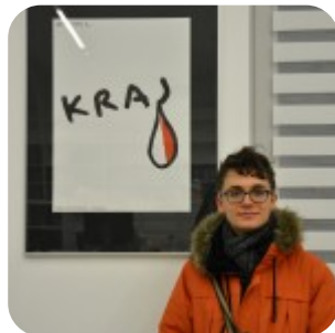
Wernisaż wystawy "Plakaty" - fotorelacja