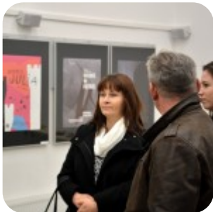
Wernisaż wystawy "Plakaty" - fotorelacja