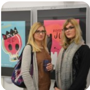
Wernisaż wystawy "Plakaty" - fotorelacja