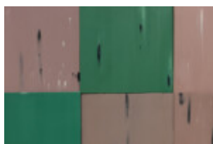
Linoleum 3, 2022, 26 elementów 30 x 30 cm, olej na dykcie, instalacja