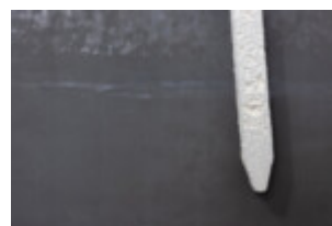
Skrob skrob, 2022, 90 x 30 cm, zegar, tablica ołowiana, głośnik detal