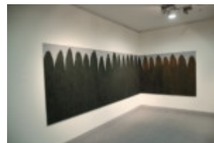
„Farbopłot”, 2015, fot. Wojciech Pacewicz