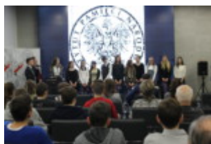
Uczniowie ZSP w Lublinie